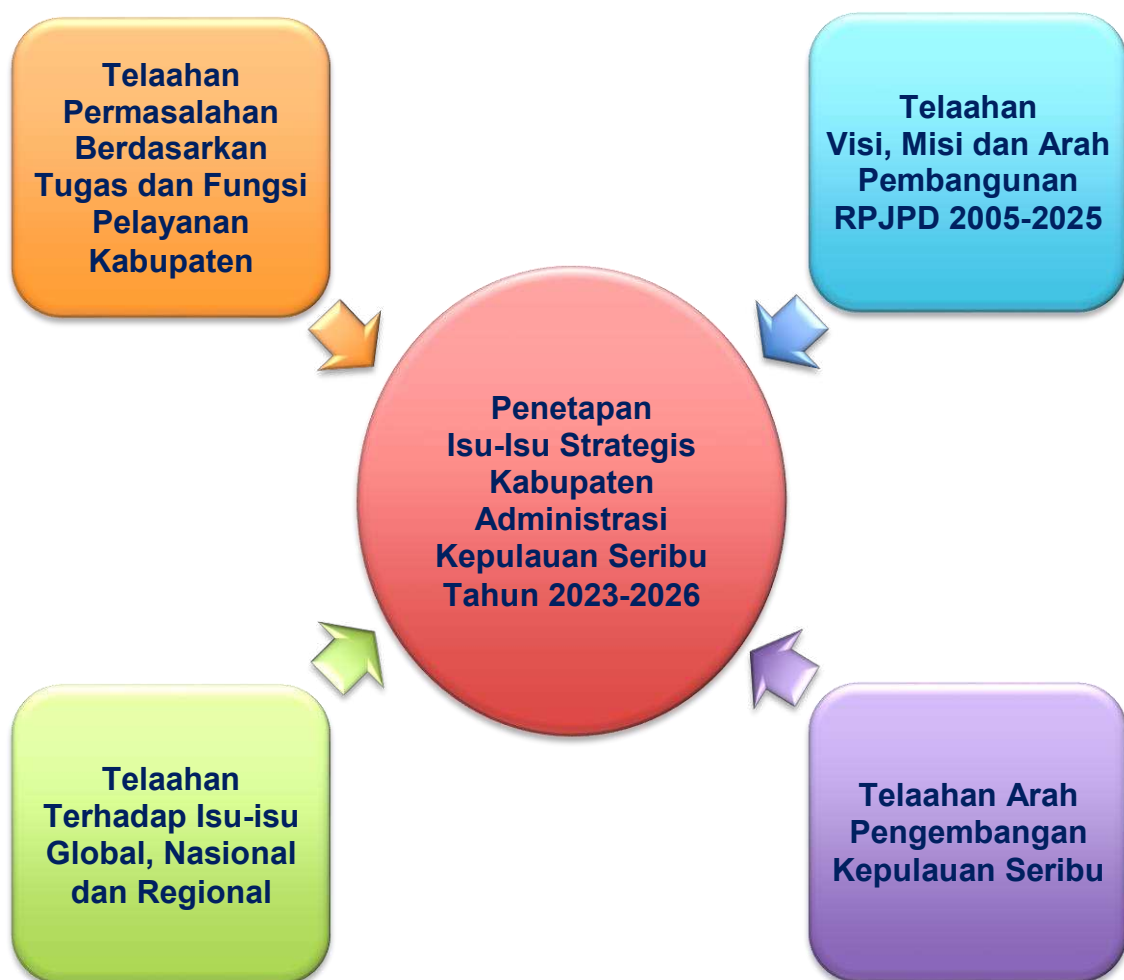
Gambar 2.3. Alur Penetapan Isu Strategis Kabupaten Administrasi Kepulauan Seribu

Perlu digaris bawahi bahwa perumusan isu-isu strategis dibatasi oleh kewenangan yang dimiliki Kabupaten Administrasi Kepulauan Seribu. Dengan kata lain isu yang terumuskan adalah isu-isu yang dapat menjadi diberikan solusi oleh Kabupaten Administrasi Kepulauan Seribu sesuai kewenangannya. Dalam hal ini perumusan isu strategis sangat menghindari munculnya isu-isu yang tidak dapat diberikan solusi oleh Kabupaten Administrasi Kepulauan Seribu. Dari tahapan identifikasi permasalahan, maka dapat disintesis beberapa aspek dan permasalahan utama yang menjadi dasar penetapan isu-isu strategis.