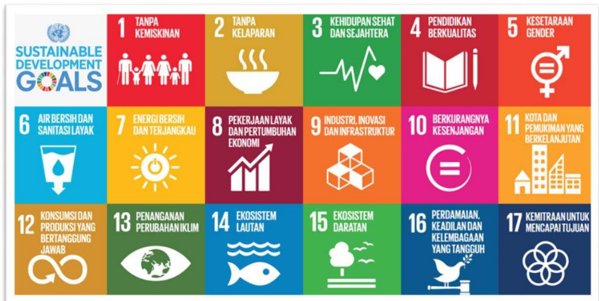
Gambar 3.1 Tujuan Pembangunan Berkelanjutan/Sustainable Development Goals (TPB/SDGs)

Tujuan Pembangunan Berkelanjutan/Sustainable Development Goals (TPB/SDGs) merupakan kerangka kerja pembangunan yang memiliki tiga dimensi pembangunan berkelanjutan, yaitu ekonomi, sosial dan lingkungan. TPB/SDGs diformulasikan ke dalam 17 Goals, 169 Target/Sasaran, dan 241 Indikator. Dalam Gambar 3.1 terdapat rincian tujuh belas tujuan TPB/SDGs.